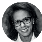
Audrey PULVAR Présidente de la Fondation pour la Nature et l'Homme et co-présidente du jury des TROPHÉES

« Nous avons voulu construire ensemble cet événement pour que le monde de l'innovation et du digital puisse mieux rencontrer l'économie circulaire afin d'accélérer la transition écologique. »